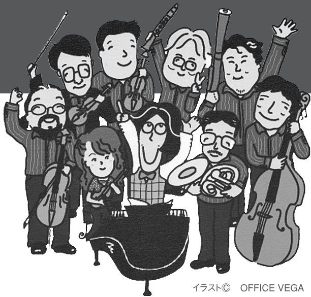
イラスト© OFFICE VEGA