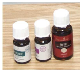
左から ペパーミント、ラベンダー、ティートリー