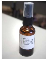
シールも貼って万能オイルの完成